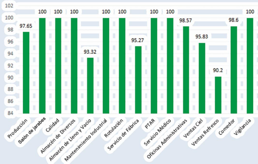
EFFECTIVIDAD ASPECTO AMBIENTAL "GENERACIÓN DE RESIDUOS DE MANEJO ESPECIAL" SEPTIEMBRE