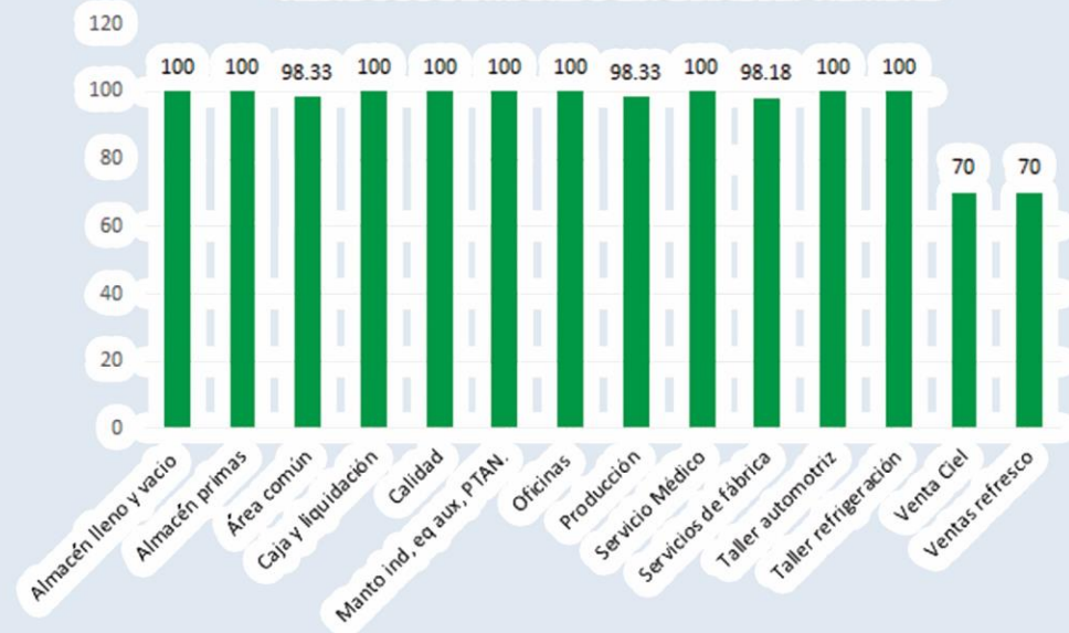
EFFECTIVIDAD EN LA SEPARACIÓN DE RESIDUOS DE MANEJO ESPECIAL SEPTIEMBRE