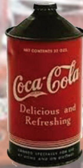
Esta es la primera lata de Coca-Cola de la historia de 1942.

Y la New Coke de 1985, que recientemente ha sido tema de