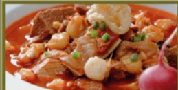
COMIDA FAVORITA Pozole rojo con cachetito