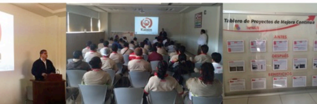
Grupo Embotellador Nayar agradece las iniciativas de sus colaboradores para ir mejorando cada día.

Al finalizar el protocolo de presentación se invitó a los presentes a degustar de unos deliciosos bocadillos.